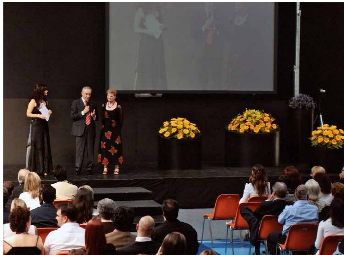
Un momento della cerimonia di conferimento della Rana d'Oro.