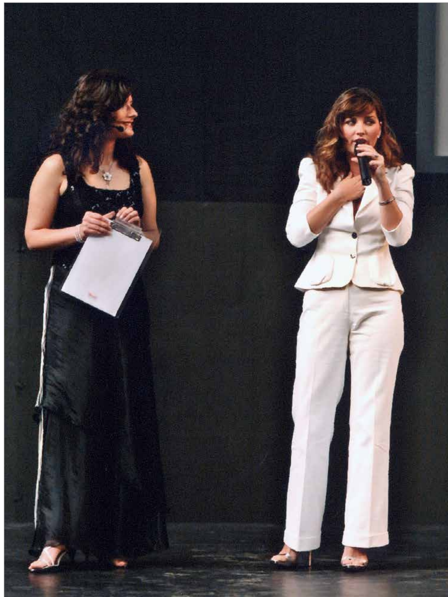
Nella pagina a fianco l'attrice Vanessa Gravina.